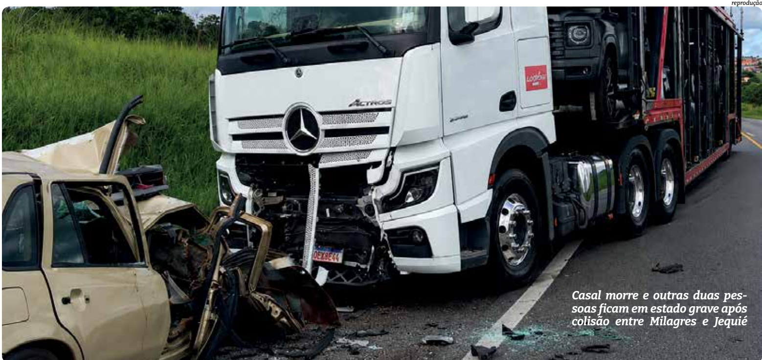
Casal morre e outras duas pessoas ficam em estado grave após colisão entre Milagres e Jequié

“Quando a gente faz uma análise dessas causas, são diversas. Tanto associadas à atenção e ao tempo de reação do motorista, como também causas ligadas ao excesso de velocidade, às ultrapassagens indevidas e à mistura de álcool e direção”, destacou a inspetora.