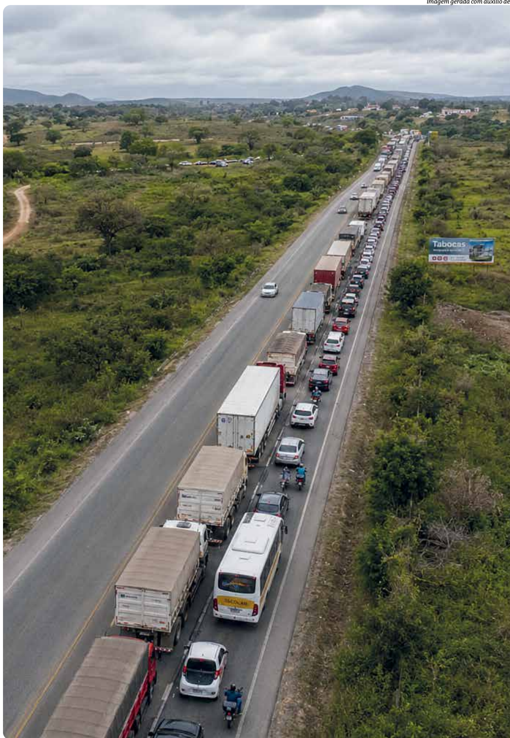
imagem gerada com auxílio de ai

Segundo o estudo, embora a BR-101 ainda concentre mais acidentes, a BR-116 passou a registrar ocorrências mais trágicas. Isso significa que colisões parecidas provocam mais mortes e feridos graves na estrada que começa em Fortaleza e termina na fronteira do Brasil com o Uruguai.