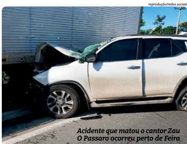
Acidente que matou o cantor Zau O Passaro ocorreu perto de Feira

A especialista afirma que, em locais onde a duplicação ainda não é viável, a implantação de terceiras faixas em trechos de subida pode ajudar a reduzir os riscos. Segundo Denise, a medida cria uma faixa adicional para veículos pesados em acíves, permitindo que carros de passeio realizem ultrapassagens com mais segurança.