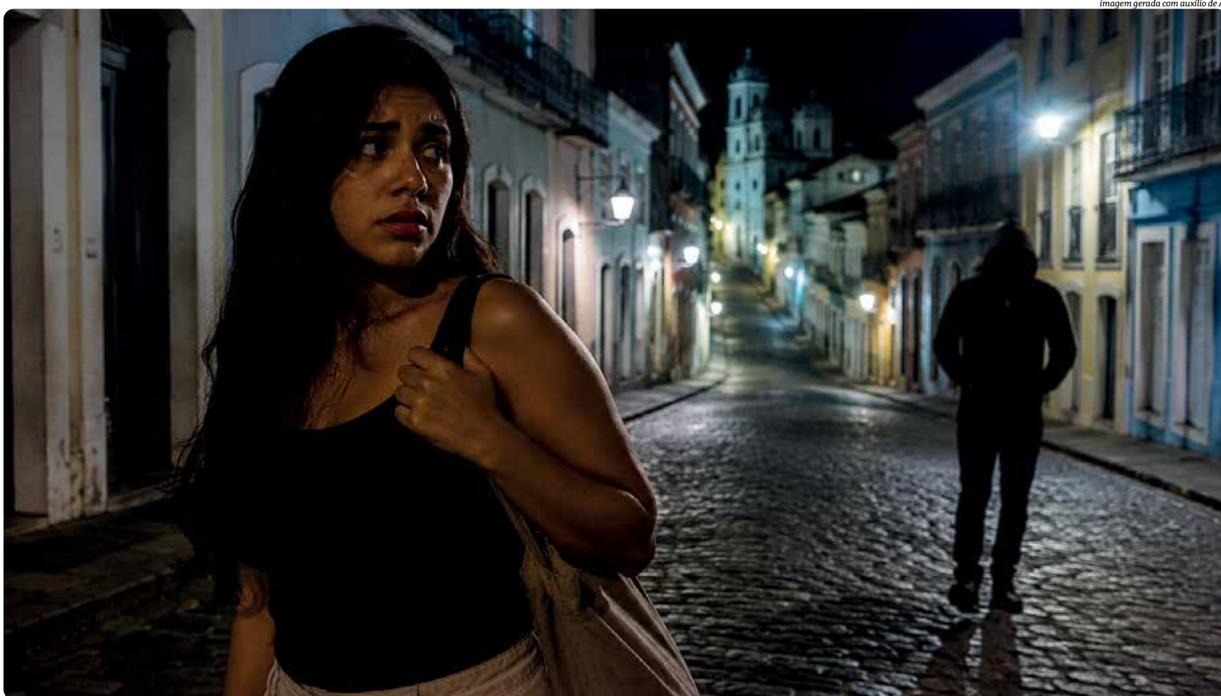
imagem gerada com auxílio de AI

Para ela, a sensação é de alerta constante. “Eu não consigo descansar, ficar com a mente em paz quando eu estou sozinha caminhando em algum lugar. Principalmente à noite”, afirma. A pedagoga relata ainda que sente alívio quando percebe que outra mulher está próxima. “É uma glória quando a gente enxerga uma mulher vindo na nossa direção”, emenda