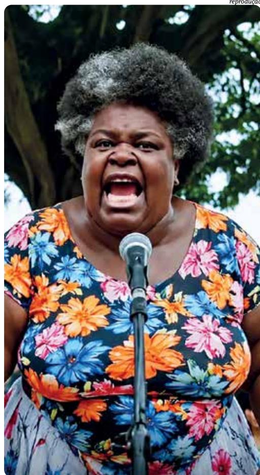
Três exemplos de mau uso da inteligência artificial para atacar candidatos; velocidade de criação dificulta combate pelo TSE