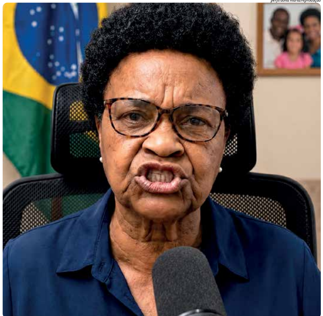
perfil dona maria/reprodução

A discussão ganhou novo capítulo quando PT, PV e PCdoB, partidos que integram a Federação Brasil da Esperança, acionaram o TSE pedindo a derrubada de perfis ligados à personagem em plataformas como Instagram, TikTok, Facebook,