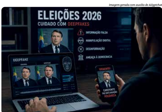
imagem gerada com auxílio de AI/gptchat

Mesmo assim, boa parte dos conteúdos produzidos com IA ainda circula sem qualquer identificação. Hoje, poucos segundos de áudio já são suficientes para clonar a voz de alguém. O velho “eu nunca disse isso” ganhou novas camadas de complexidade numa era em que um vídeo falso pode circular muito mais rápido do que qualquer desmentido.