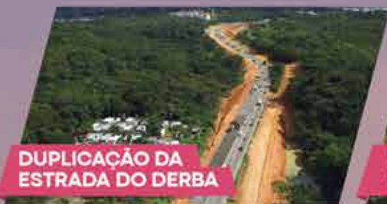
DUPLICAÇÃO DA ESTRADA DO DERBA