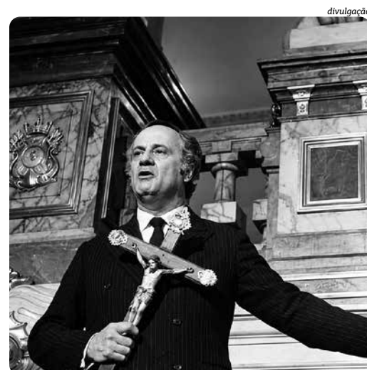
Paulo Autran em cena de Terra em Transe , uma das sete obras do baiano disponíveis gratuitamente

No meio desse vasto acervo, a Bahia encontra um espaço privilegiado. E isso passa, inevitavelmente, pela presença de Glauber Rocha. Nascido em Vitória da Conquista, o diretor transformou o sertão, a desigualdade social e as contradições políticas do país em matéria-prima para uma das filmografias mais influentes da América Latina. Líder do movimento Cinema Novo, Glauber ajudou a redefinir os rumos do cinema brasileiro ao defender uma estética comprometida com a realidade nacional.