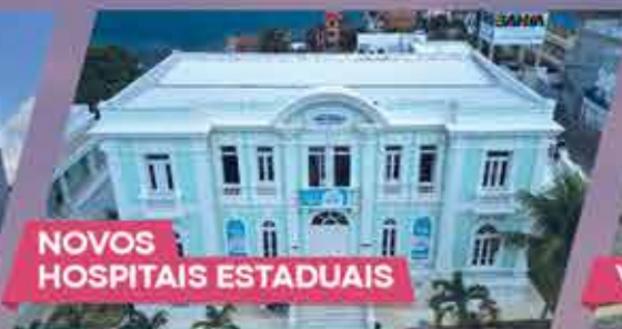
NOVOS HOSPITAIS ESTADUAIS