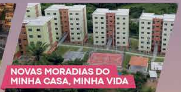
NOVAS MORADIAS DO MINHA CASA, MINHA VIDA