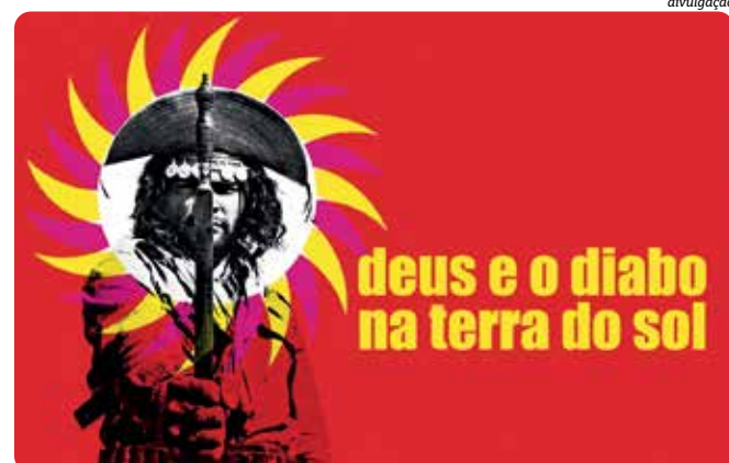
Cartaz de um dos filmes mais aclamados do Cinema Novo, protagonizado pelo também baiano Othon Bastos