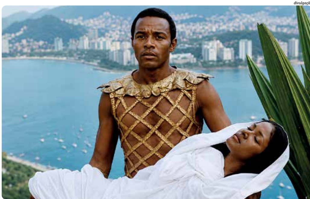
Orfeu Negro, do francês Marcel Camus, integra a seleção de clássicos

O catálogo também reúne Carandiru (2003), de Hector Babenco, adaptação da obra do médico Drauzio Varella. Embora não tenha recebido indicação ao Oscar, o longa foi premiado em festivais internacionais e se consolidou como um dos maiores sucessos de público do cinema brasileiro contemporâneo ao retratar o cotidiano do antigo presídio de São Paulo antes do massacre de 1992.