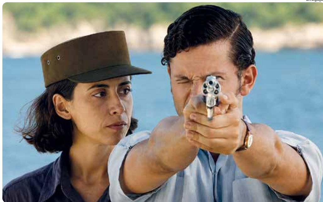
Selton Mello e Fernanda Torres em O que é Isso, Companheiro