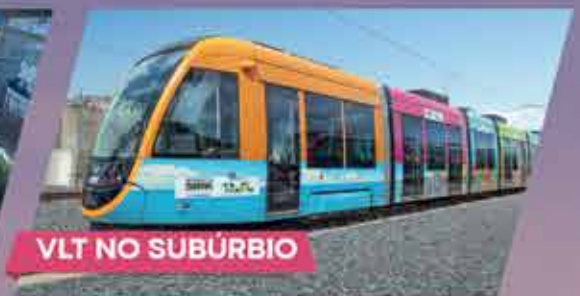
VLT NO SUBÚRBIO