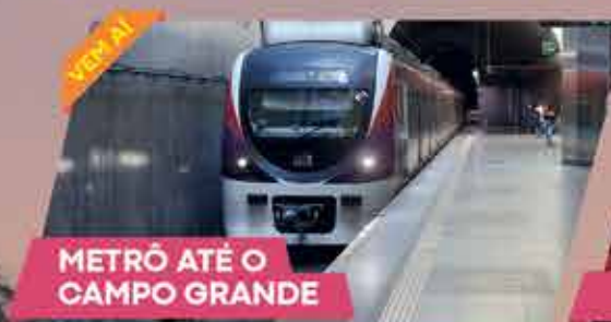
METRÔ ATÉ O CAMPO GRANDE