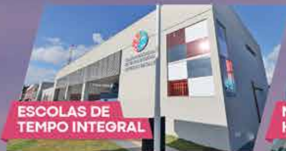
ESCOLAS DE TEMPO INTEGRAL

O Governo da Bahia tá ajudando a melhorar a vida na nossa capital. São Escolas de Tempo Integral fazendo nossos estudantes superarem desafios, novos hospitais ampliando o atendimento a quem mais precisa, obras de mobilidade adiantando o lado das pessoas e novas moradias para as famílias. Ainda tem mais a fazer, por isso, o trabalho continua. É o Governo do lado da gente.